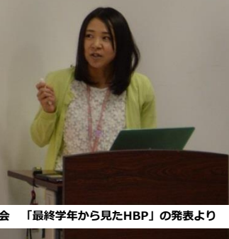
H29.6.9 HBP説明会 「最終学年から見たHBP」の発表より