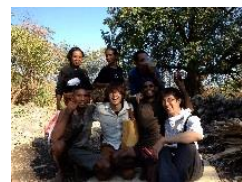
Appropriate Technology フィールドワークの様子

お問合せ：筑波大学 グローバル教育院(SIGMA) 〒305-8577 茨城県つくば市天王台1-1-1 Tel: 029-853-7085 e-mail: sigma@un.tsukuba.ac.jp