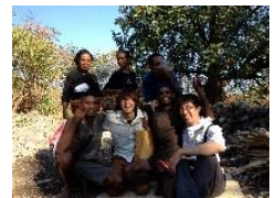
Appropriate Technology フィールドワークの様子